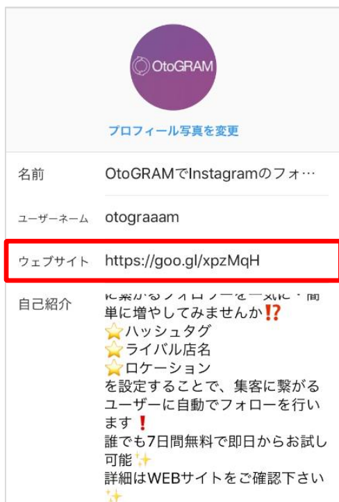
プロフィール編集ページ